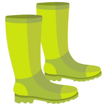
Der Stiefel (Zwei Stiefel)