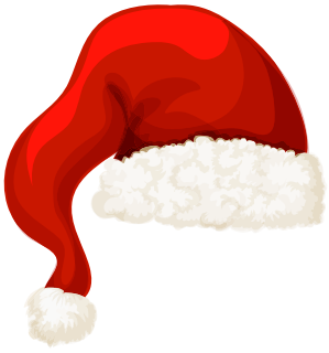
Die (Nikolaus-) Mütze