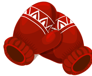
Der Handschuh (Zwei Handschuhe)