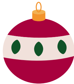
Die Weihnachtskugel oder Der Baumschmuck